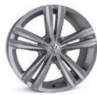
Легкосплавные колесные диски "Sebring" 7J x 17