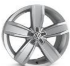
Легкосплавные колесные диски "Istanbul" 7J x 17 стандартно для Business 2.0L