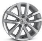
Легкосплавные колесные диски "Sepang" 6,5 J x 16 стандартно для Business 1.4L