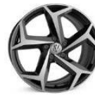
Легкосплавные колесные диски "Bonneville" 8J x 18