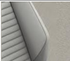
Комбинированная обивка сидений из искусственной замши/кожи светло-серого цвета