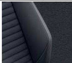
Комбинированная обивка сидений из искусственной замши/кожи черного цвета