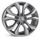
Легкосплавные колесные диски "Soho" 7J x 17 стандартно для Exclusive 2.0L