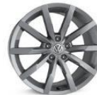
Легкосплавные колесные диски "Monterey" 8J x 18