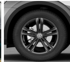
Sebring 7J x 18