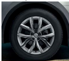
Kingston 7J x 18