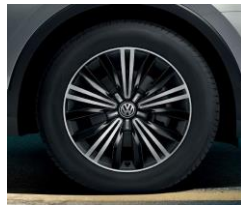
Nizza 7J x 18