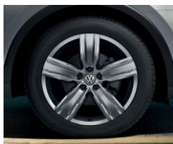
Victoria Falls 7J x 19