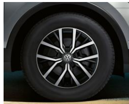
Tulsa 7J x 17